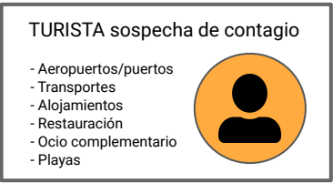
Diagrama de flujo: sospecha de contagio

Se contactará desde el punto en que se encuentre el turista con la Autoridad Sanitaria competente y con el centro sanitario de referencia (público o privado)